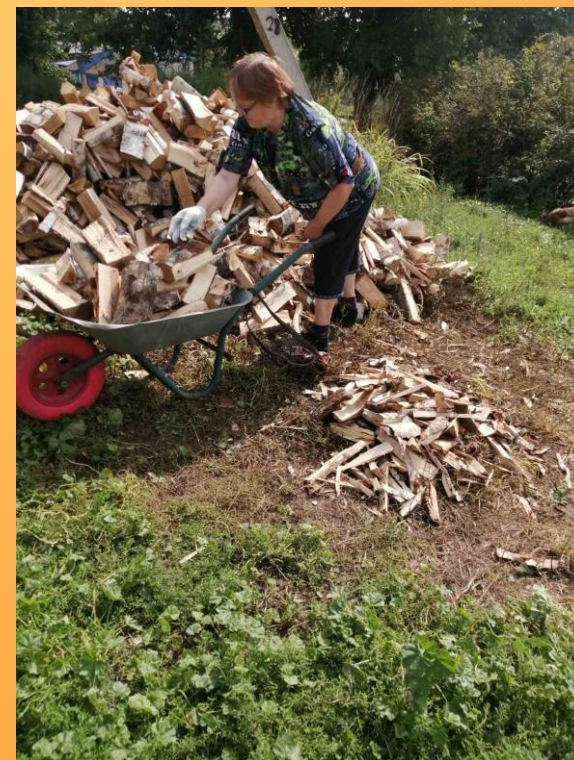
Добрым людям помогаем