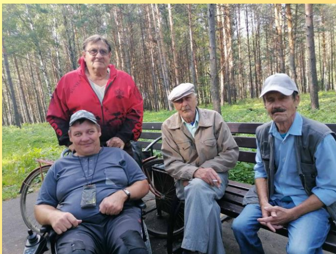
Вместе дружно отдыхаем