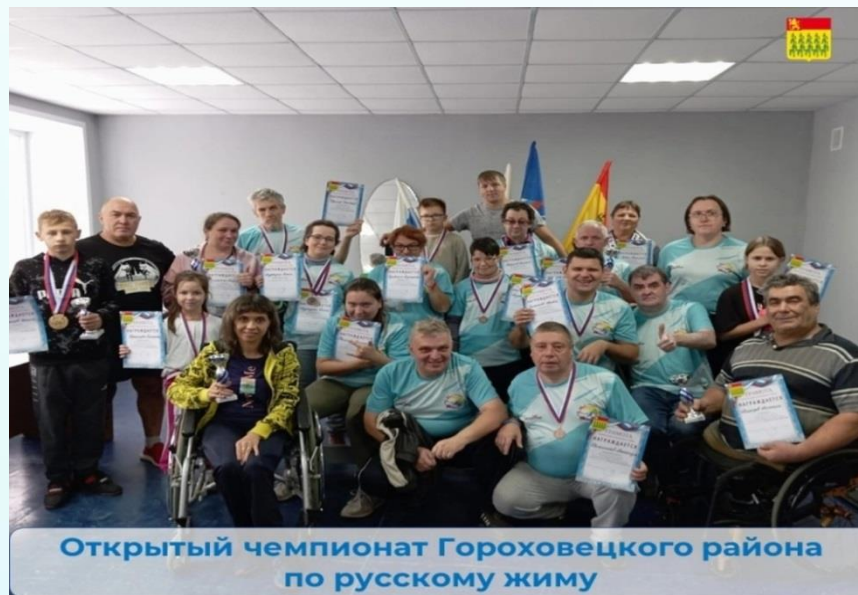
Открытый чемпионат Гороховецкого района по русскому жиму