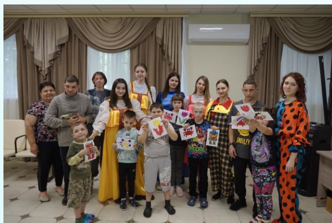
Курская районная ВОИ