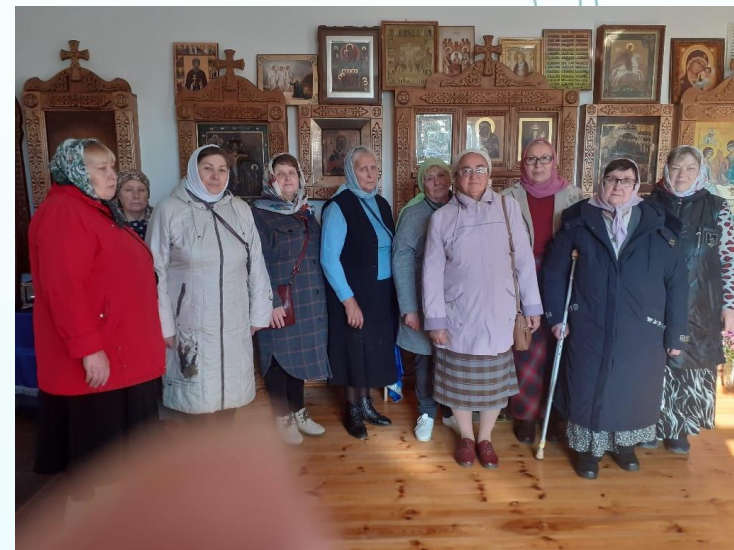
Курчатовское отделение ВОИ