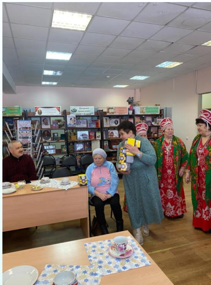
Сеймское окружное общество ВОИ