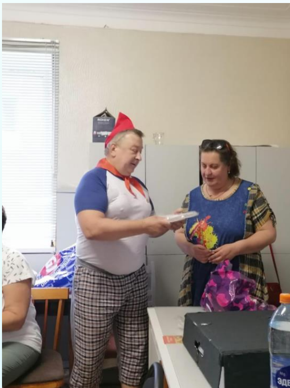
Курская городская организация ВОИ

2165 человек с инвалидностью занимались и общались в 18 творческих клубах, действующих при местных организациях