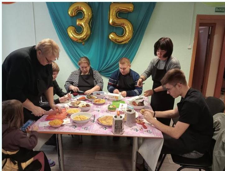
Железногорское отделение ВОИ