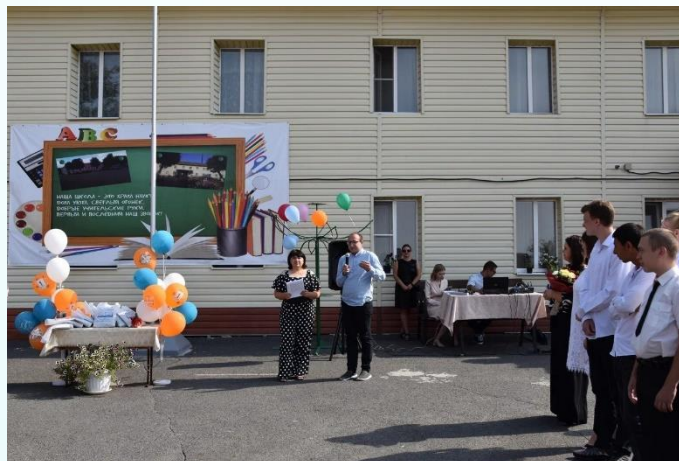
Обоянское отделение ВОИ