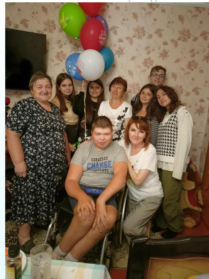
Рыльское отделение ВОИ